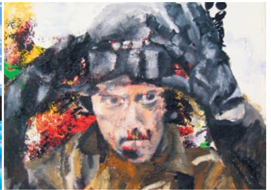
Dreimal Fiktion vs. Realität: Fotografie von Matthias Heipel (oben), Malerei (Ausschnitte) von Adrian Germann (links unten) und Paul Takács.

nen, wird die Interpretation gültiger als der reale Moment, der reale Hund.