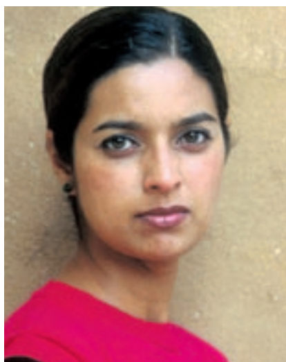
Melancholisch: Jhumpa Lahiri.

In «Einmal im Leben» geht es um Hema und Kaushik, deren Wege sich nur dreimal kreuzen, Anfang der Siebzigerjahre im Haus der Eltern bei Boston, dann als Teenager und Jahre später überraschend in Rom. Aus Kaushik ist ein bekannter Kriegsphotograf geworden, der rastlos durch die Welt zieht. Hema ist das genaue Gegenteil,